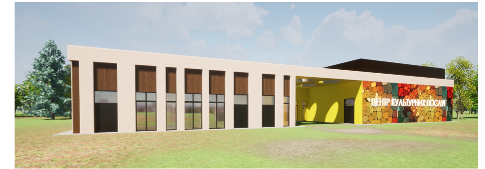
Зовнішній (проектний) вигляд оптимального варіанту Центру культурних послуг

розроблено в рамках проекту "Центри культурних послуг, як інструмент згуртованості громади", який реалізується Товариством дослідників України за підтримки Швейцарії, яка надається через Швейцарську агенцію розвитку та співробітництва (SDC) у тісній співпраці та на замовлення Міністерства культури та інформаційної політики України